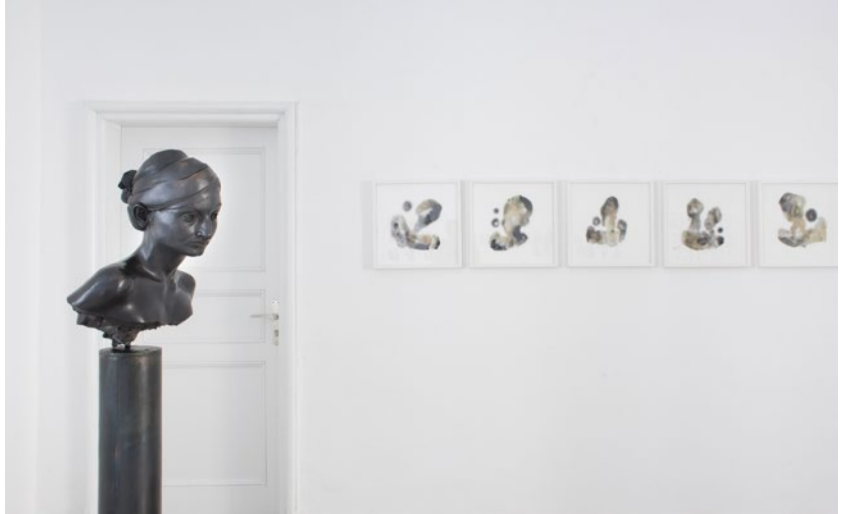
Werk: Raphael Ginbar (Bronze) und Layall Alawad (Tuschezeichnungen)

Geeignete Bewerberinnen und Bewerber laden wir zu einer Aufnahmeprüfung ein. Bitte bringen Sie zu diesem Termin Ihre aussagekräftige Mappe mit. Die Mappe sollte eine ausgearbeitete Skizze Ihres geplanten Masterprojektes sowie Arbeitsproben enthalten, die Ihre bisherige künstlerische Arbeit dokumentieren. Das Kollegium des Fachbereichs Bildende Kunst sichtet während der Prüfung die eingereichten Mappen und führt mit Ihnen ein Aufnahmegespräch. Hier haben Sie Gelegenheit, Ihre Studienmotivation und Ihre Projektskizze zu erläutern.