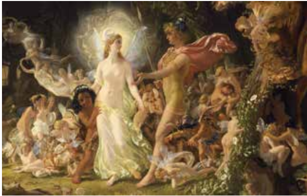
Foto: Sir Joseph Noel Paton - The Quarrel of Oberon and Titania - Google Art Project 2

Es begann mit der Ermordung eines Otters... Oder: Zum 400. Todesjahr des Welt dramatiklers William Shakespeares bringen Studierende der Alanus Hochschule sein berühmtestes Stück und auch seine Hintergründe auf die Bühne.